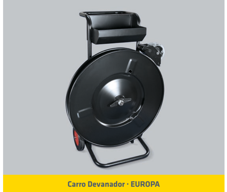
Carro Devanador · EUROPA

ANCHO DEL FLEJE (mm) : 19 / 25 / 32 ESPESOR DEL FLEJE: 0,8 - 1 mm