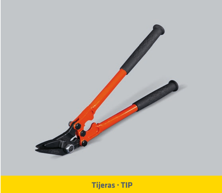
Tijeras · TIP

ANCHO DEL FLEJE (mm) : 19 / 25 / 32 ESPESOR DEL FLEJE: 0,8 - 1 mm