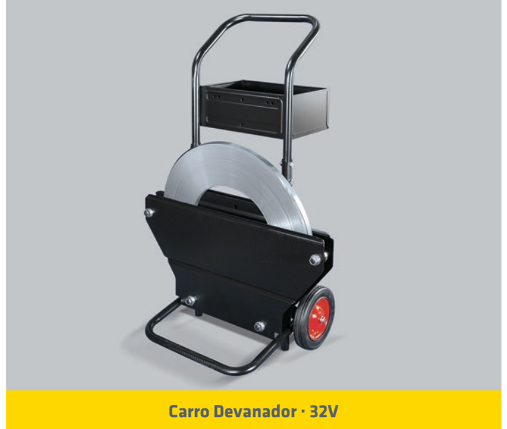
Carro Devanador · 32V

ANCHO DEL FLEJE (mm) : 19 / 25 / 32 ESPESOR DEL FLEJE: 0,8 - 1 mm