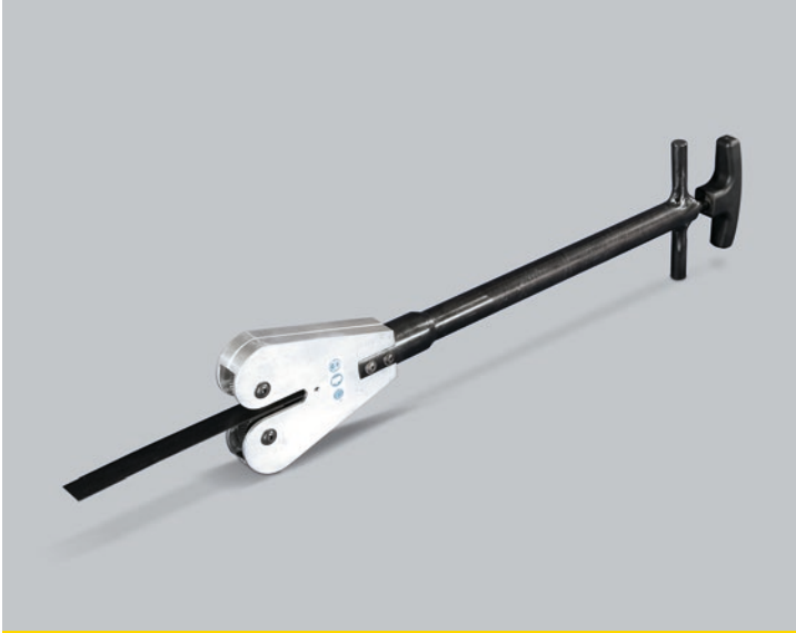
Tirador de chapas · TCH / TCHL

Ligera, manejable y sencilla, está especialmente diseñada para evitar las lesiones que puede ocasionar al operario la manipulación de chapas y flejes.