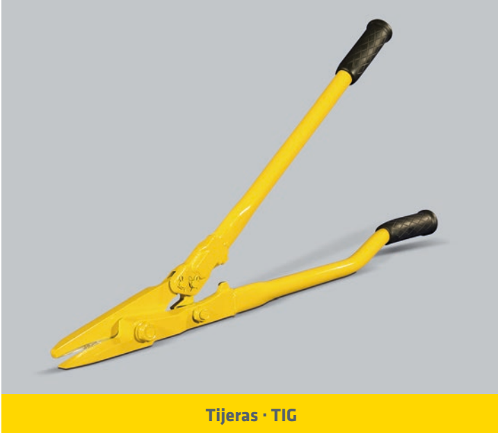
Tijeras · TIG

ANCHO DEL FLEJE (mm) : 19 / 25 / 32 ESPESOR DEL FLEJE: 0,8 - 1 mm