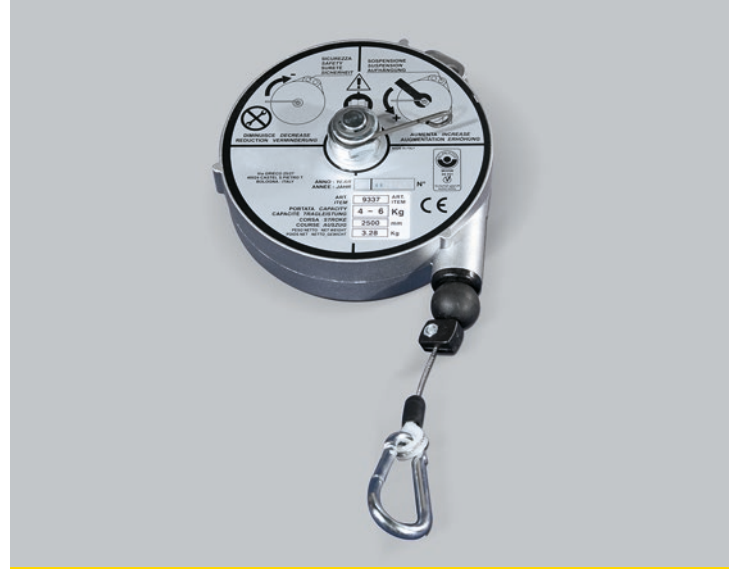
Suspensores y Equilibradores para flejadoras

Mod. TCHL: Desbloqueo a una mano con liberador.