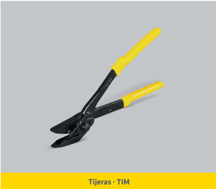
Tijeras · TIM

ANCHO DEL FLEJE (mm) : 13 / 16 / 19 / 32 ESPESOR DEL FLEJE: 0,4 - 1 mm