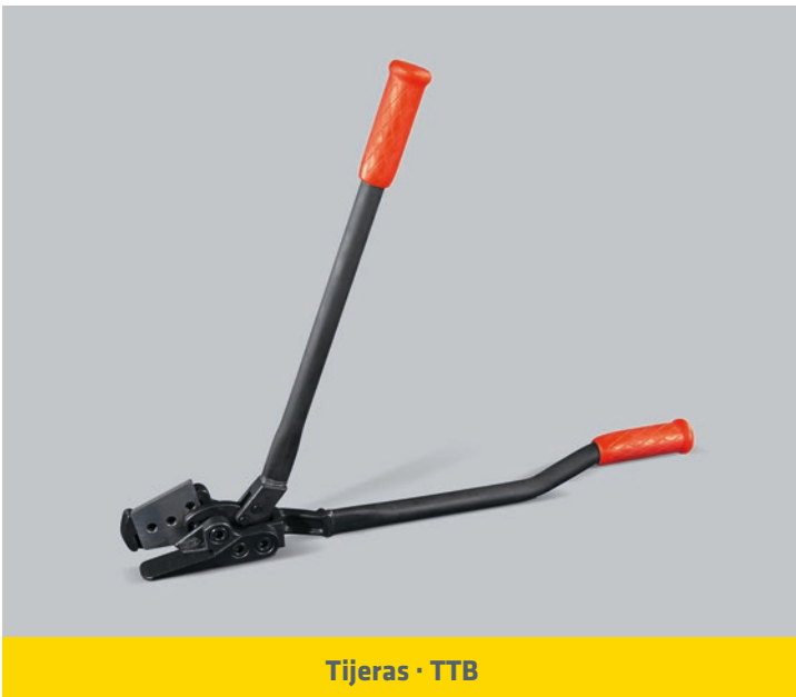
Tijeras · TTB

Carro para fleje de Acero Oscilado y Poliéster.