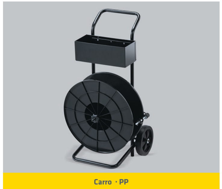
Carro · PP

ANCHO DEL FLEJE (mm) : 19 / 25 / 32 ESPESOR DEL FLEJE: 0,8 - 1,2 mm