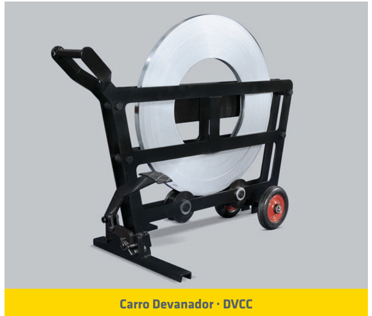
Carro Devanador · DVCC

ANCHO DEL FLEJE (mm) : 13 / 16 / 19 / 32 ESPESOR DEL FLEJE: 0,4 - 1 mm